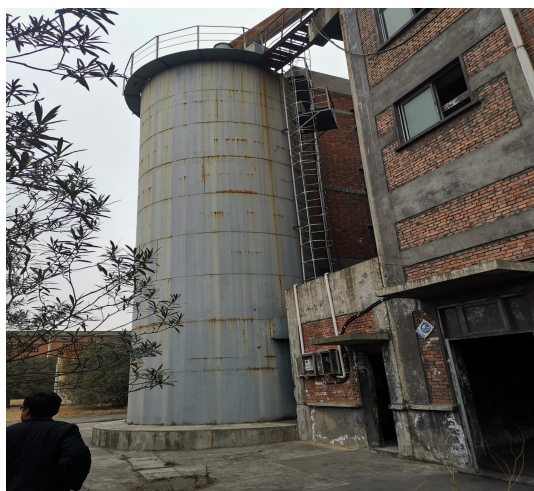
图 11 （配套设备）