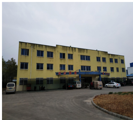
图 14 （办公综合楼）