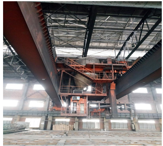
图 6 （焙烧车间行车）