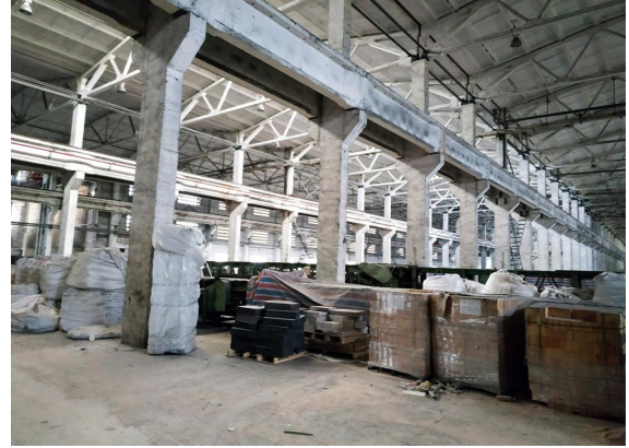
图 4 （材料中转车间）