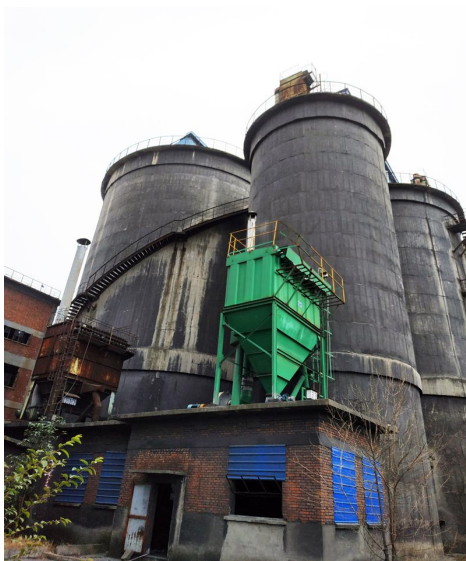
图 7 （煨后料仓）