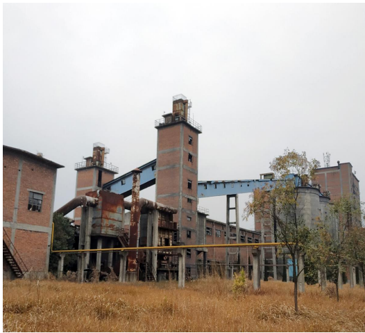
图 5 （煨烧设施外景）