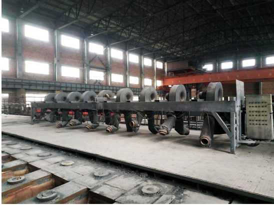
图 3 （焙烧车间冷确设备）