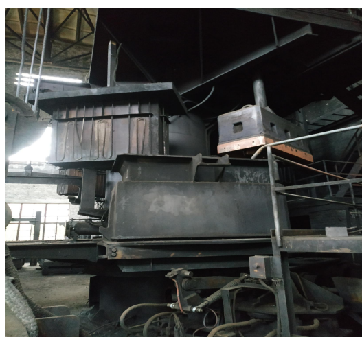
图 12 （定型模具）