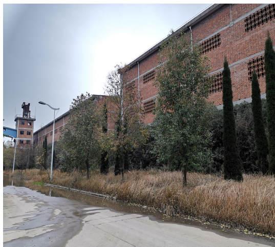
图 13 （石油焦、沥青焦库房）