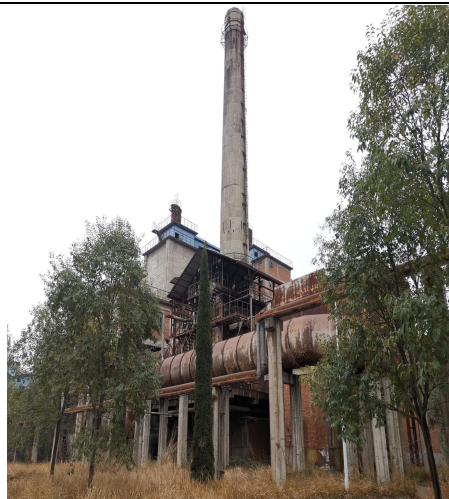
图 10 （烟囱）