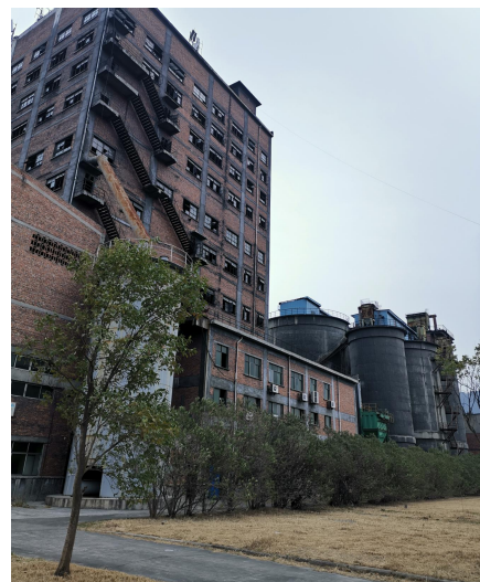
图 8 （生阳极高楼部）