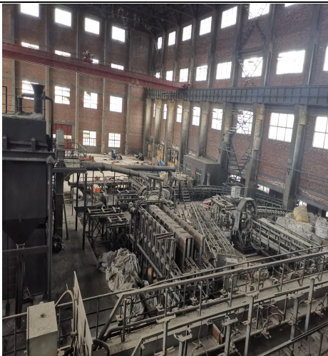
图 9 （焙烧设备）